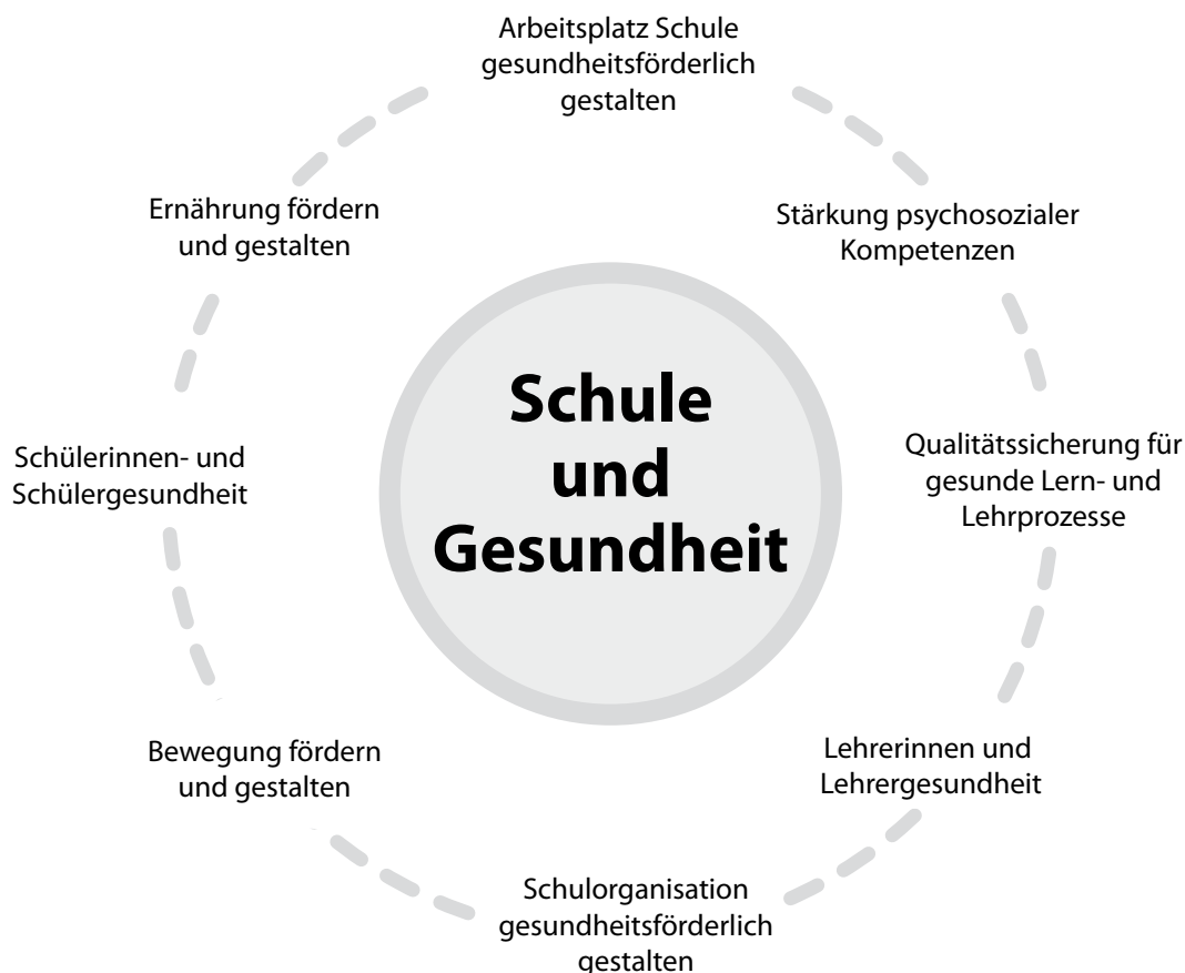
Abb. 2: Handlungsfelder für eine gesunde Schulentwicklung

Organisationen und Einrichtungen. Auch die Förderung des Nichtrauchens bei Kindern und Jugendlichen ist ein wichtiger Themenbereich der LVG & AFS. Unter dem Titel „Be Smart - Don't Start“ wurde der Wettbewerb zur Förderung des Nichtrauchens bei Kindern und Jugendlichen im Schuljahr 2008/2009 zum neunten Mal in Niedersachsen angeboten. Der Wettbewerb richtet sich an alle siebten bis neunten Klassen der Sekundarstufe I. Zudem engagiert sich die LVG & AFS in der Landesinitiative: „die initiative“ Bildung – Gesundheit – Entwicklung, in die die langjährigen Erfahrungen des Arbeitsbereichs Schule und Gesundheitsförderung der LVG & AFS einfließen. 2009 sind wichtige Partner wie der Gemeinde-Unfallversicherungsverband und die Bertelsmannstiftung hinzugekommen. Das Niedersächsische Kultusministerium und das Landesamt für Lehrerbildung und Schulentwicklung unterstützen „die initiative“ in der Weiterentwicklung.