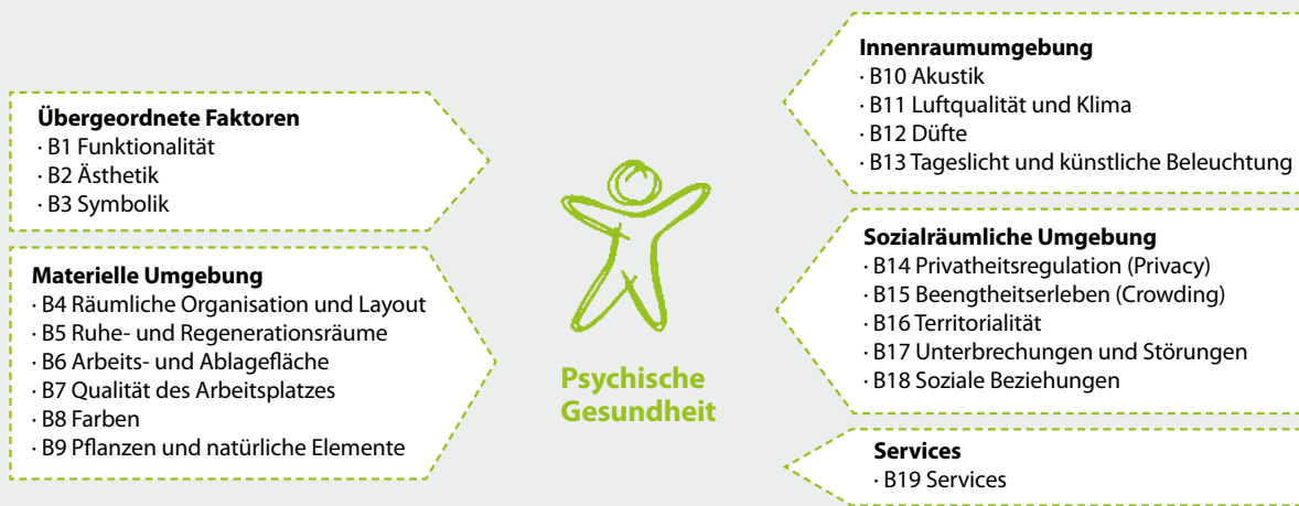
Abbildung: Übersicht Einflussfaktoren im Büroraum auf die psychische Gesundheit

Formale Präventionsempfehlungen zur individuellen Verhaltensprävention, die als »Rezept« von den Krankenkassen bei ihrer Leistungsentscheidung zu berücksichtigen sind, sind bislang ausschließlich Ärzt*innen vorbehalten und gehören noch nicht zum Leistungsspektrum der Psychotherapeut*innen. Angesichts des Stellenwerts psychischer Erkrankungen sollten Präventionsempfehlungen in dieser Form auch von Psychotherapeut*innen zu einem Leistungsangebot der Krankenkassen führen.